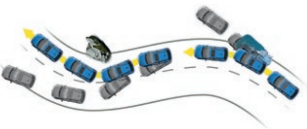
ESC com VSM

Estabilidade em linha reta (SLS) Nas travagens em linha reta, este sistema deteta eventuais diferenças na pressão de travagem entre as rodas do lado esquerdo e do lado direito, ajustando essa pressão de modo a contrabalançar o desvio daí resultante e mantendo assim o veículo na trajetória pretendida.