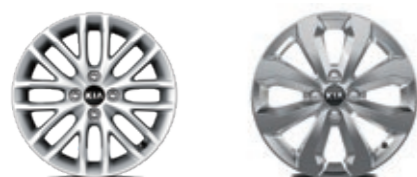
Jante de liga leve de 15"